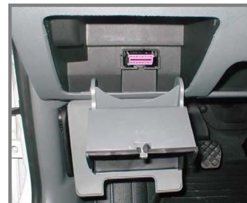
Senzory ESP [ http://www.eveman.ro ]